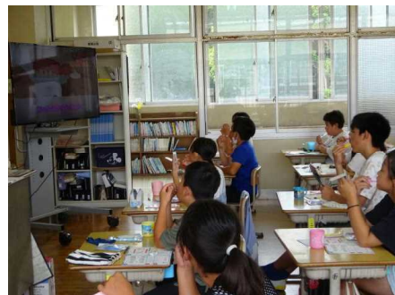
〔映像を見ながら、歯みがきの実習〕